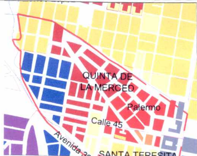
CRECIMIENTO HISTÓRICO - CRONOLOGÍA